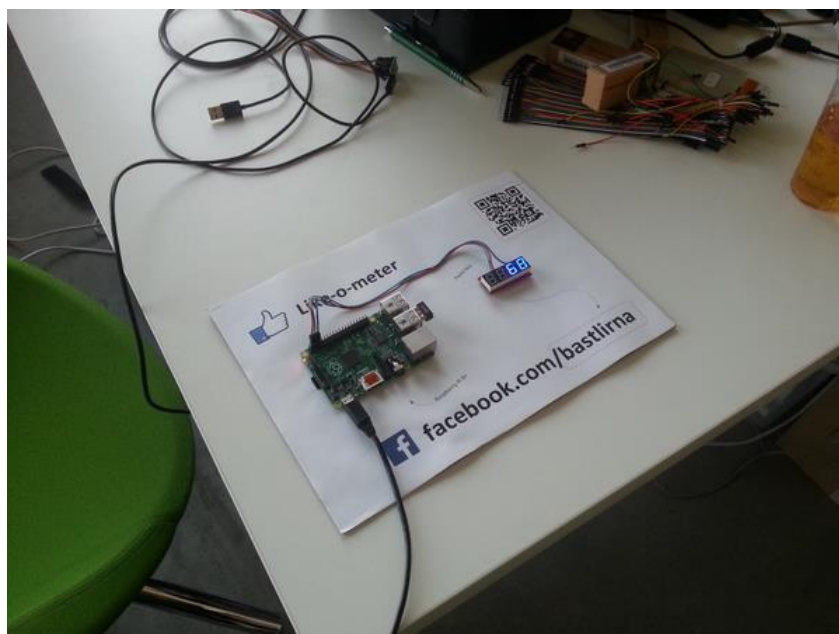
Obrázek 1 – Like-o-meter

Začátkem zimního semestru 2014/2015 se projekt prezentoval na Akci prvák. Vlastní stánek měl také robotický kroužek, kde prezentoval svého soutěžního robota. V rámci celého projektu proběhl den otevřených dveří, který byl propagován také mimo Strahov (FEL, FIT, Karlovo náměstí). Projekt byl oficiálně zapsán do mezinárodního registru elektro – mechanických dílen ( http://hackerspaces.org ). Projekt se také proaktivně zúčastnil několika velkých akcí, kde prezentoval klub jako celek: